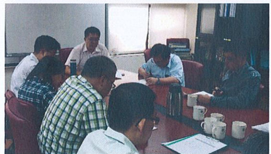
社群成員互相討論與經驗分享(5)