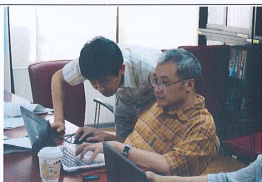
演講者與成員老師之互動與討論(8)