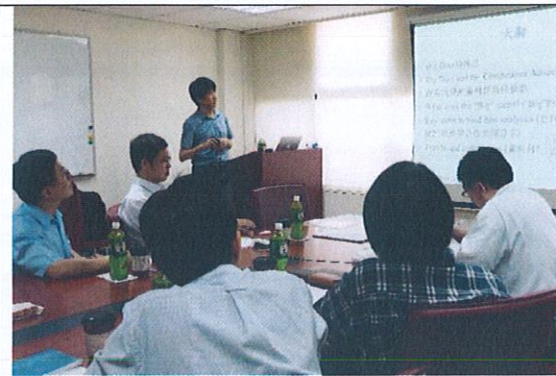
鄒教授演講與授課過程(1)