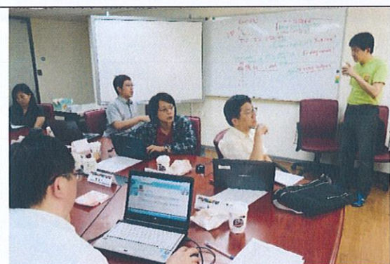
演講者與成員老師之互動與討論(5)