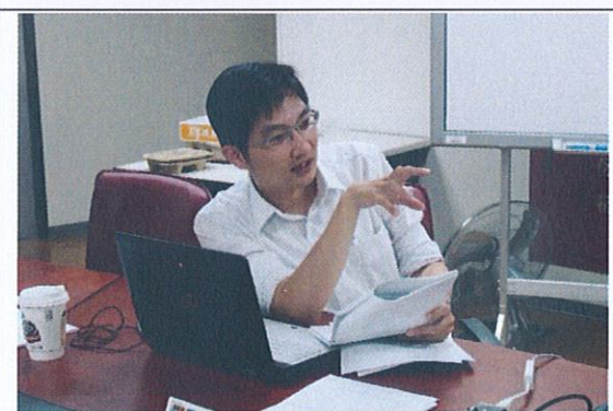
演講者與成員老師之互動與討論(9)