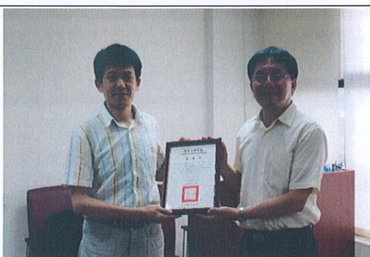
系上主任頒贈感謝狀給予演講者