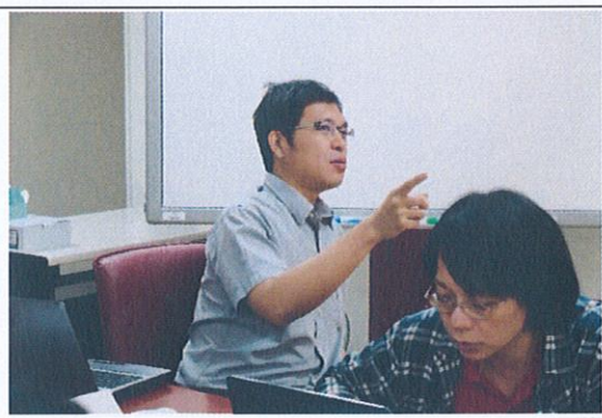
演講者與成員老師之互動與討論(4)