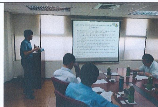
鄒教授演講與授課過程(2)