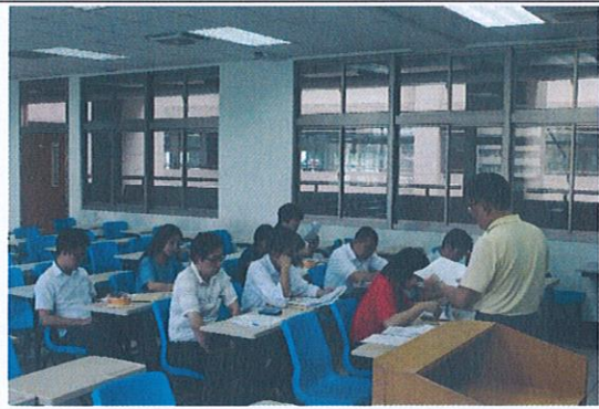
社群成員互相討論與經驗分享(3)