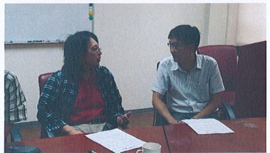
社群成員互相討論與經驗分享(6)