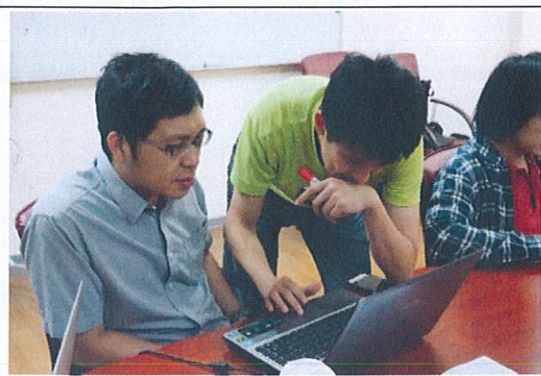
演講者與成員老師之互動與討論(7)