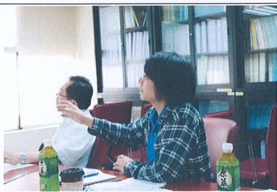
演講者與成員老師之互動與討論(2)