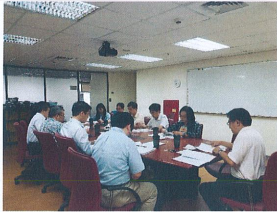
社群成員互相討論與經驗分享(1)