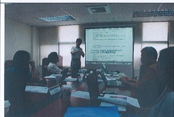
鄒教授演講與授課過程(4)