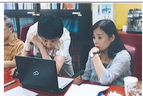
演講者與成員老師之互動與討論(11)