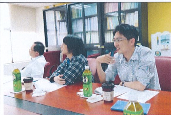
演講者與成員老師之互動與討論(3)