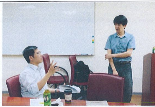
演講者與成員老師之互動與討論(1)