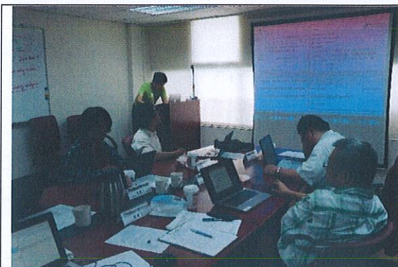
鄒教授演講與授課過程(3)