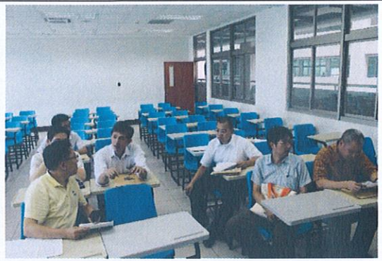
社群成員互相討論與經驗分享(4)