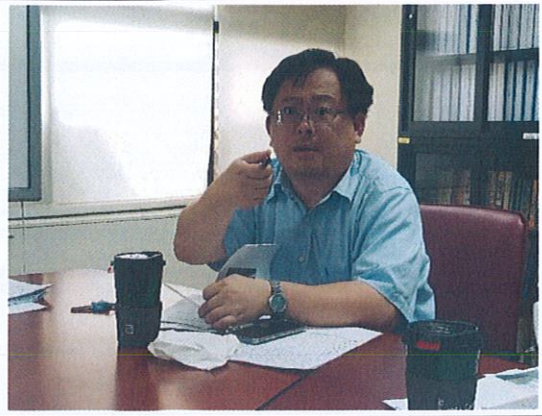
社群成員互相討論與經驗分享(2)