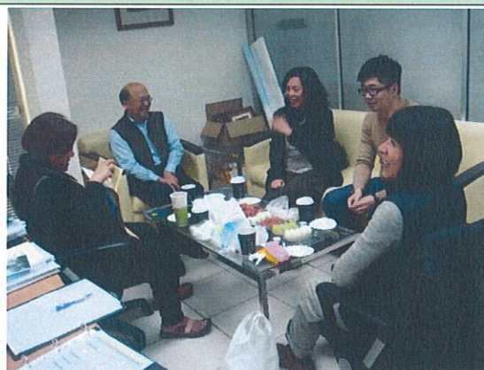
105/03/29 對於教學理念意見討論與交流