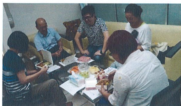
105/09/05 對於評量設計意見討論與交流