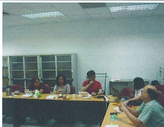
105/04/26 對於課程設計意見討論與交流