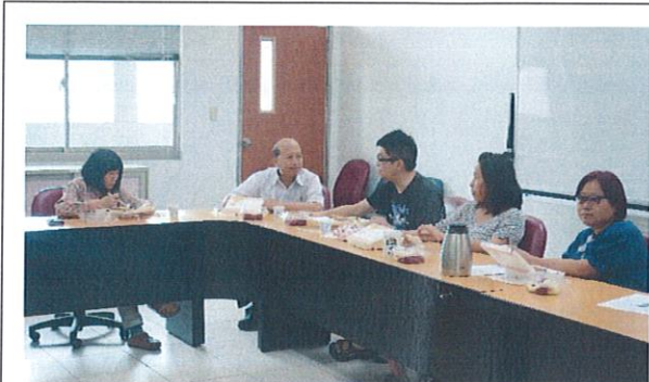
105/05/24 對於課室經營意見討論與交流