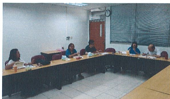
105/06/27 對於教學技巧意見討論與交流