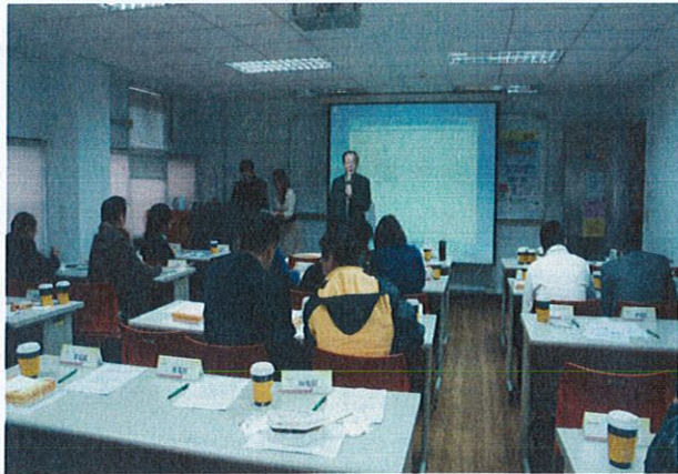
共同成長社群(活動二-1)