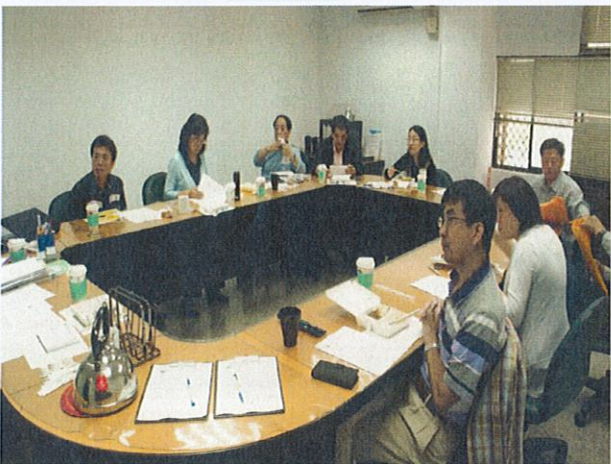
共同成長社群(活動五) (請加以)