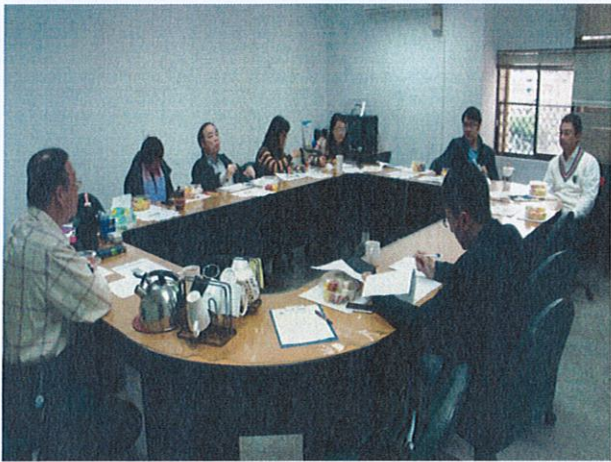
共同成長社群(活動三)