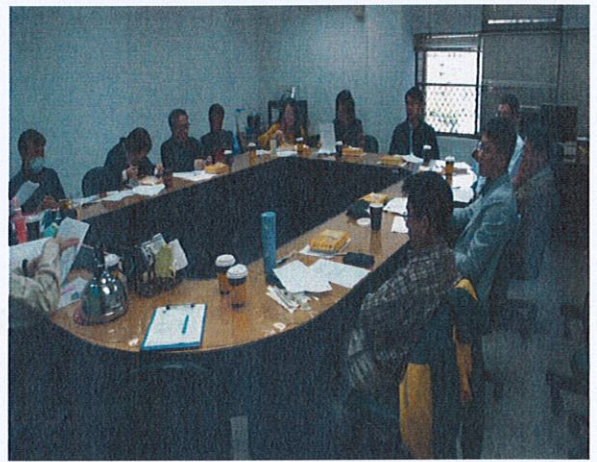
共同成長社群(活動四)