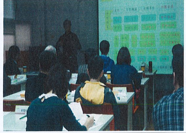
共同成長社群(活動二-2)