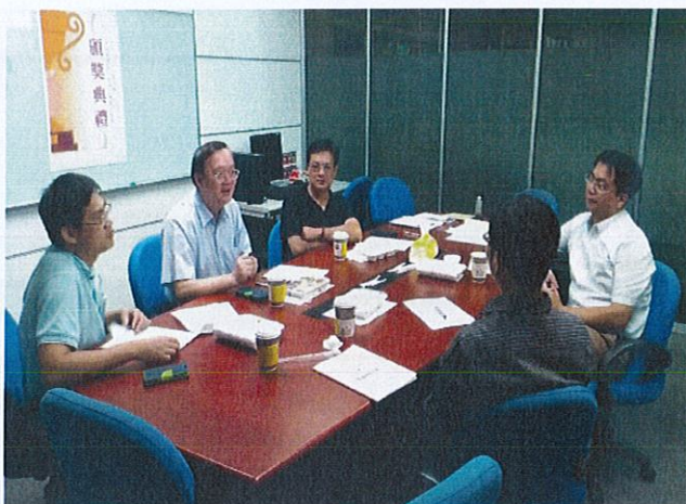
共同成長社群(活動五)(請加以