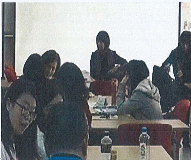
共同成長社群(活動三)