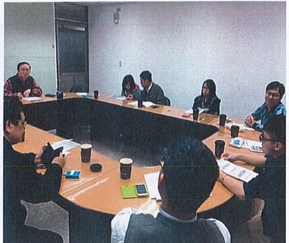
教師共同成長社群(活動一)