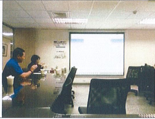
105/4/12 講解 QR code 如何操作