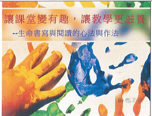
105/4/27 PPT 封面